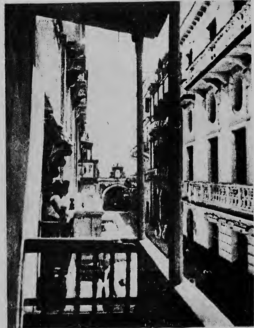
San Juan (Puerto Rico) un ciudad masha antiguo. Especialmente den interior dje ciudad bo ta haya aspectonan manera aki riba. Casnan estilo bieuz, situa na callejonan smal. E calle riba e portret aki ta Calle Cristo, popular pa e capilla historico y e negoshinan interesante.